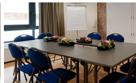
SALLE ELISABETH FREEMAN