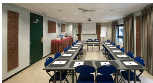
SALLE ROSA PARKS