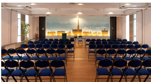
SALLE NELSON MANDELA